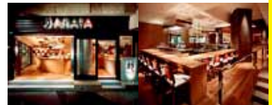
新-ARATA- (ヒルサイド B2F)