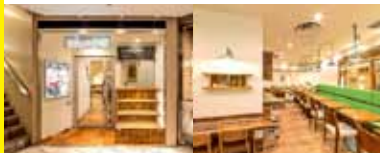
sakura食堂 (ノースタワー B1F)

六本木ヒルズ内の対象レストラン(下記3店舗)にて、仙台の冬野菜をテーマにしたメニューを期間限定で展開します。また、一部のレストランでは、同期間中に宮城県産米ひとめぼれ(数量限定)を使用。いまが旬のちぢみ雪菜・白菜・曲がりねぎなど、自慢の仙台野菜を使ったオリジナルメニューをお楽しみください。